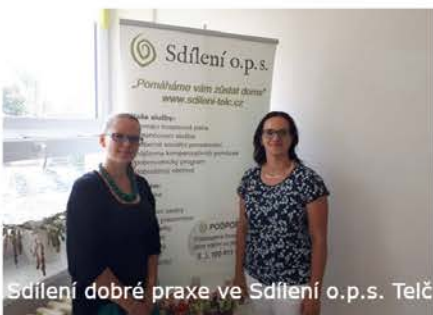
Sdílení dobré praxe ve Sdílení o.p.s. Telč