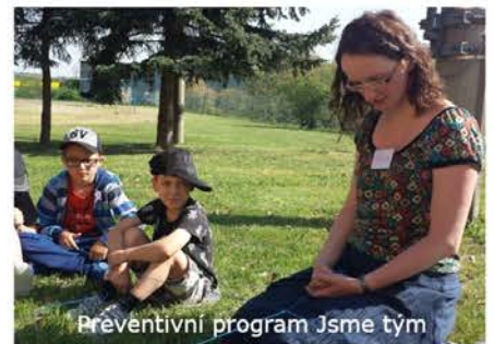
Preventivní program Jsme tým