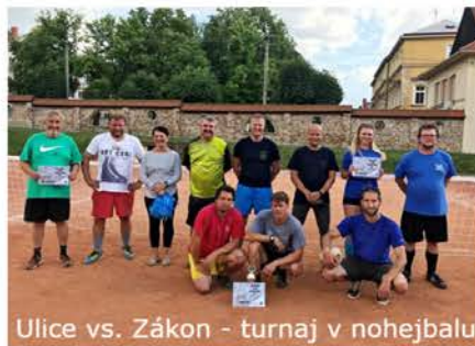
Ulice vs. Zákon - turnaj v nohejbalu