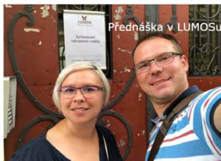
Přednáška v LUMOSu