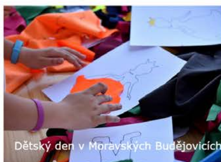
Dětský den v Moravských Budějovicích