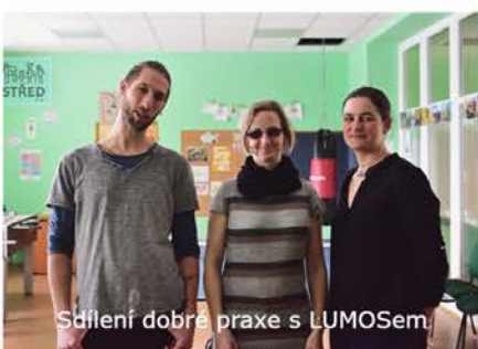
Sdílení dobré praxe s LUMOSEm