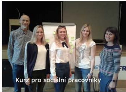
Kurz pro sociální pracovníky