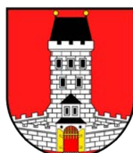
Světlá nad Sázavou