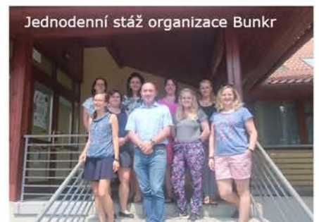
Jednodenní stáž organizace Bunkr