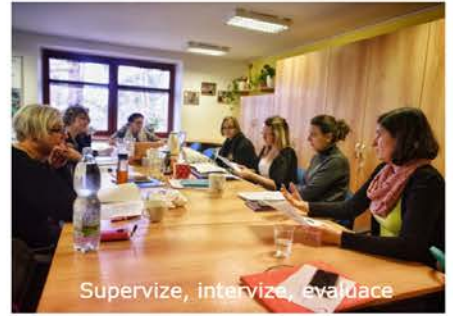
Supervize, intervize, evaluace