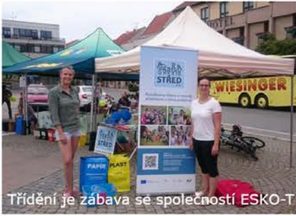
Třídění je zábava se společností ESKO-T