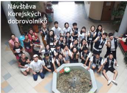
Návštěva Korejských dobrovolníků