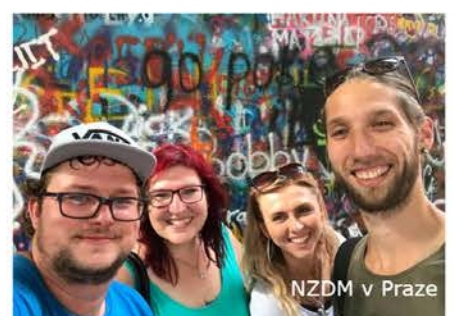
NZDM v Praze