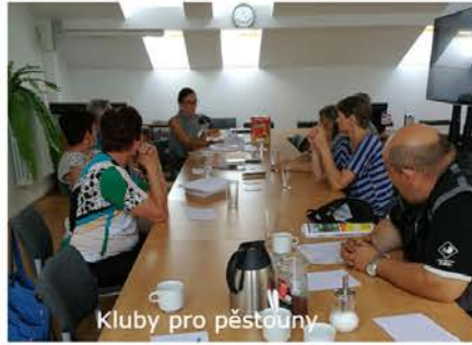
Kluby pro pěstouny