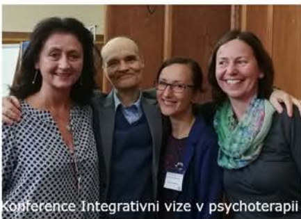
Konference Integrativní vize v psychoterapii