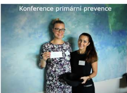
Konference primární prevence