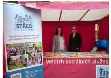
Veletř sociálních služeb