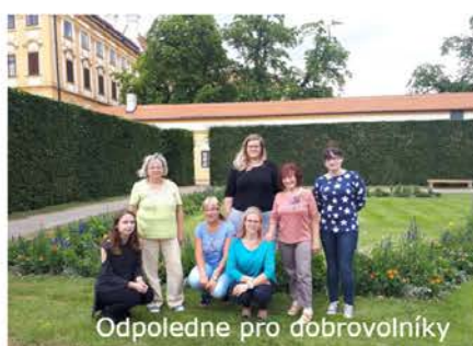
Odpoledne pro dobrovolníky